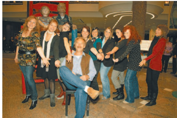
Tägliche Rettung: Die Mädels der Olle Hansen-Crew