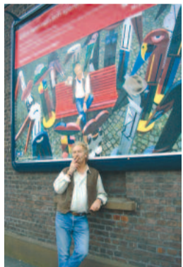
Werbung: Glück kann man sich sparen!