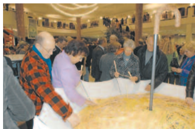
30.000 Gedicht-Strohhalme „Lebe gut!“