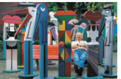
Spitzschnäblige Retrospektive: Verstorbte Gesellschaft