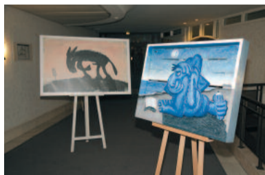
Alte Veteranen: Ackergaul und Blauer Mann