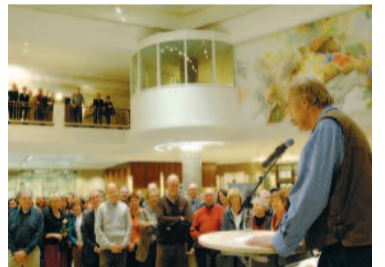
und bedankt sich artig.