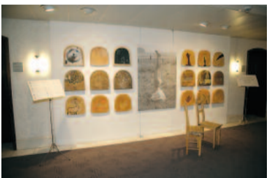
Aktuell: 40 Stühle wie du und ich