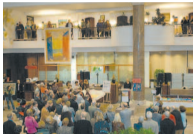
„Das haben wir ja gar nicht gewusst!“