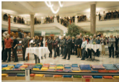
hören zu und sagen später: