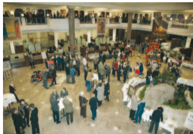
Viele Gäste kommen, sehen sich um,