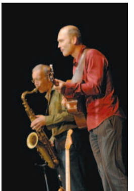
auf Parkett und Bühne