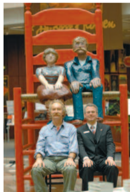
Der rote Stuhl: Ich mag dich!