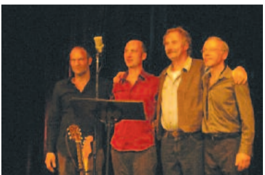
„Wir kommen wieder!“