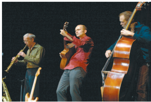
Gefühlvoller Ritterschlag: Die Stimme der deutschen Lyrik singt den Olle Hansen