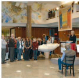
Der Künstler wird gestreichelt