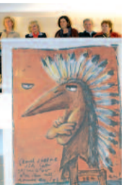
Georch hält still.